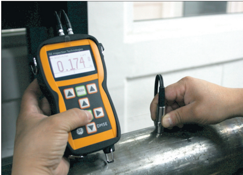
INSTRUMENT: Inspektorene i North Inspection bruker en rekke ulike instrumenter i sitt arbeid ute i felten.