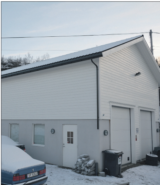
BASEN: Hovedkvarteret for bedriften ligger i Blokken, en halvtimes kjøretur fra Sortland.