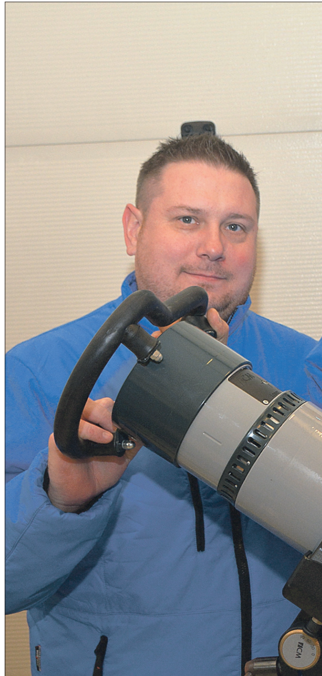
SATSER: Selv om North Inspection er en liten bedrift, har trekloveret ambisjon

- Fordi jobbingen foregår ute i felten er det vanskelig å få et inntrykk av hva vi driver med her, bortsett fra at det står en del utstyr i førsteetasjen. Men vi synes det er trivelig å ha det litt hjemmekoselig på